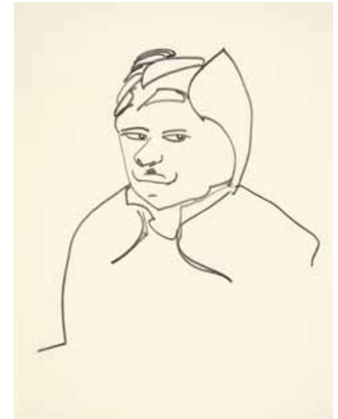
Fallensteller Zeichnung , 1993/94 Bleistift, je 21 x 15 cm Hanck 2035, 2037, 2036