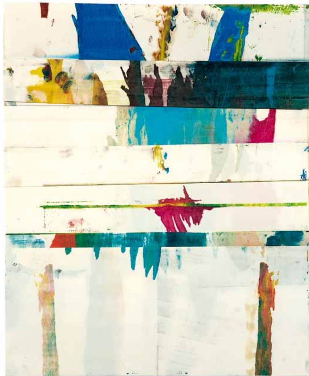
Ohne Titel , 1992/94 Öl, Faltung, 37,5 x 29 cm Hanck 617