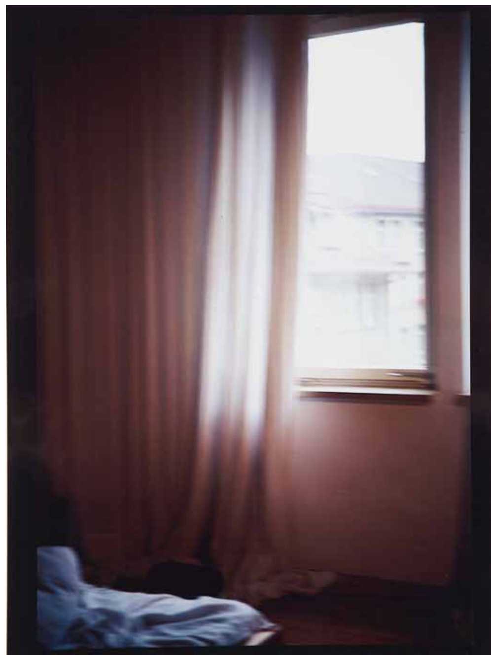
My room in halfway house, Belmont, MA, 1988 Cibachrome, 40,5 x 30,5 cm Hanck 1098b