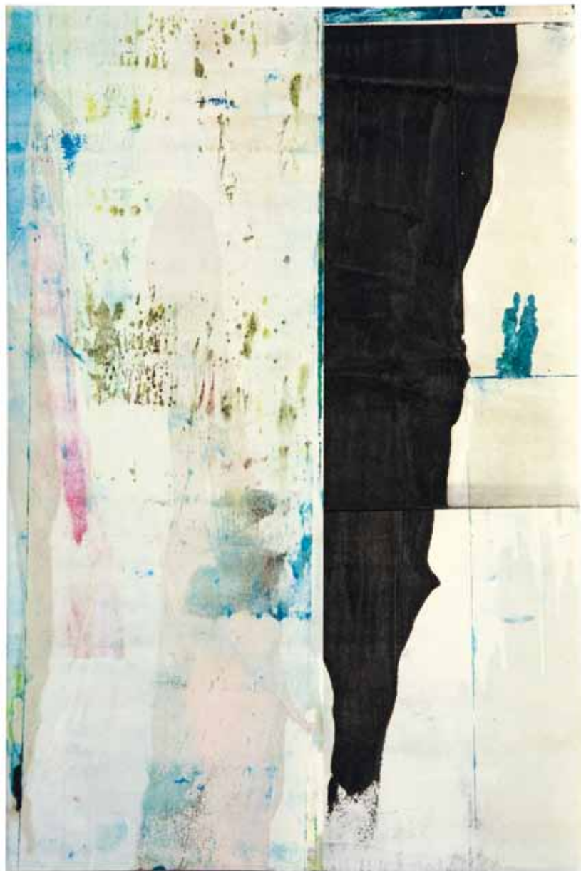
Ohne Titel , 1992/94 Aquarell, Faltung, 29,5 x 19,9 cm Hanck 618