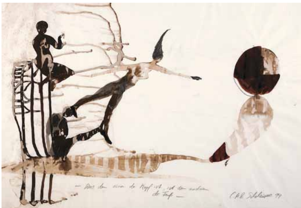
Ohne Titel, 1994 Bleistift, Tusche, 70 x 100 cm Hanck 1205