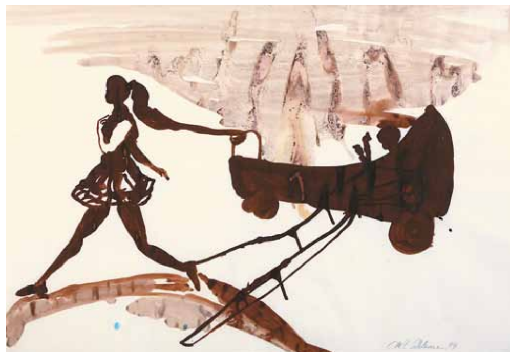
Ohne Titel, 1994 Bleistift, Tusche, 70 x 100 cm Hanck 1206