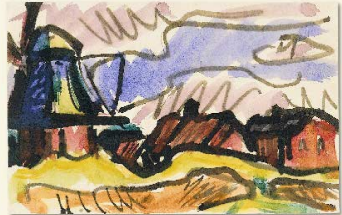
1 Windmühle und Häuser, 1909