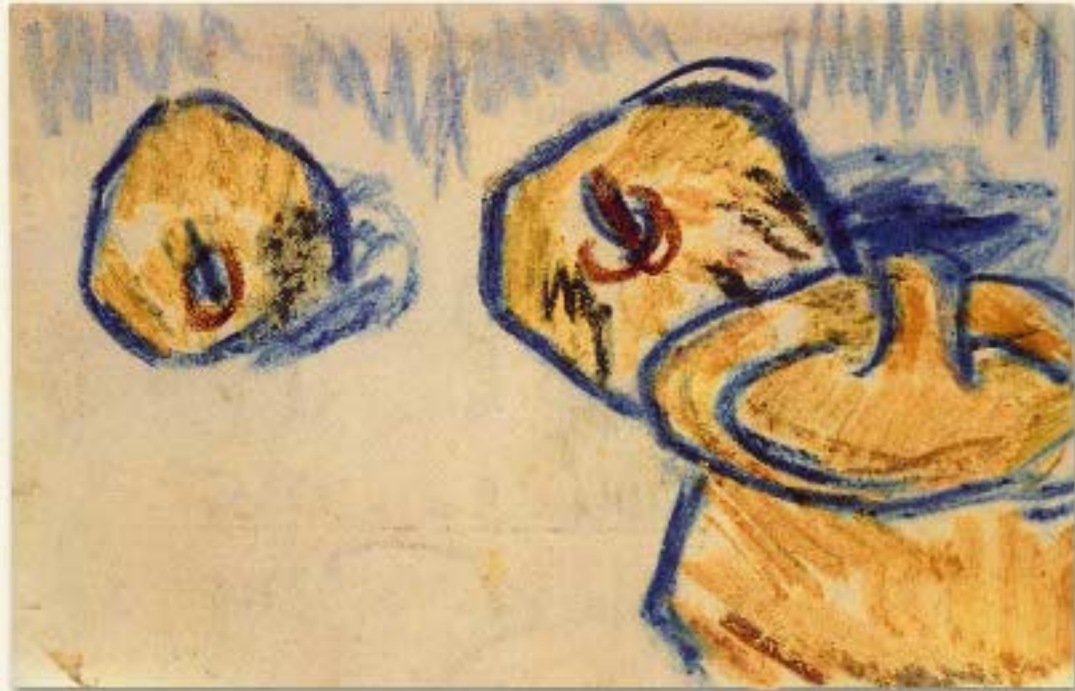
7 Stilleben mit Äpfeln und Deckeltopf, 1909