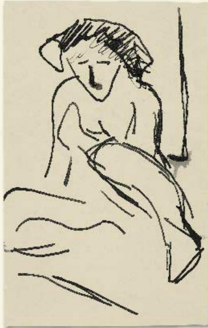
18 Sitzender Mädchenakt, 1910