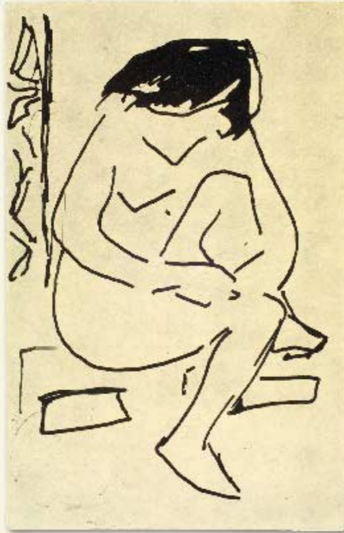
19 Sitzender Mädchenakt im Atelier, 1910