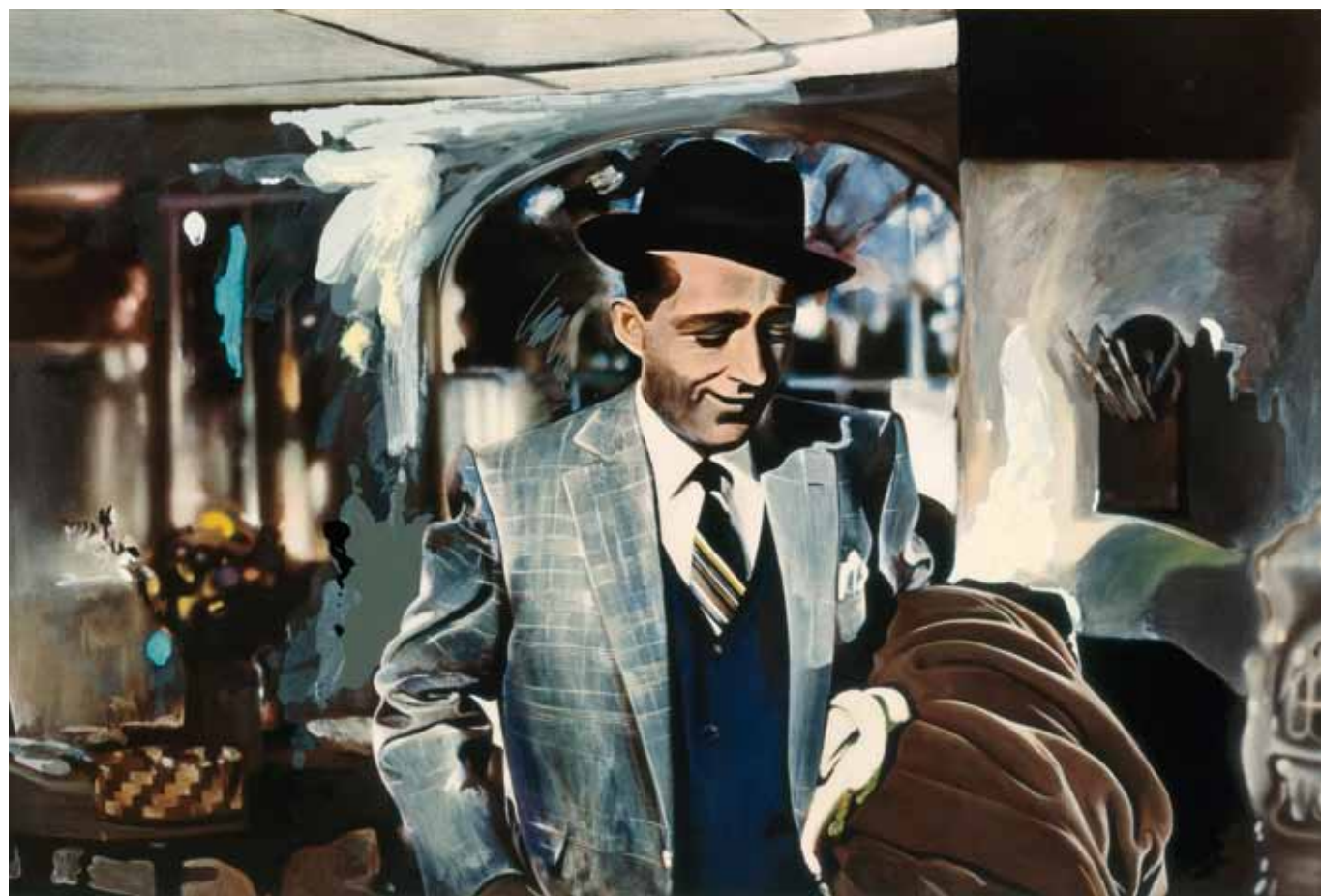
RICHARD HAMILTON Im Dreaming of a White Christmas 1967 (Kat. 20)