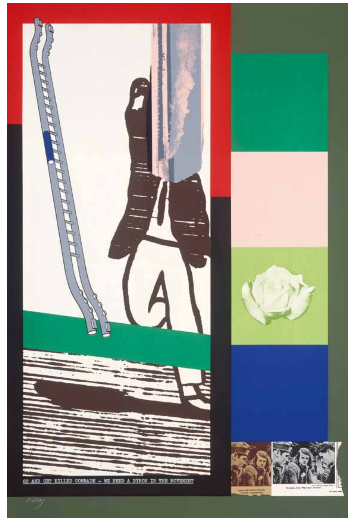
RONALD B. KITAJ What is a Comparison? 1964–67 (Kat. 35) RONALD B. KITAJ Go and Get Killed Comrade – We Need A Byron in the Movement 1964–67 (Kat. 34)