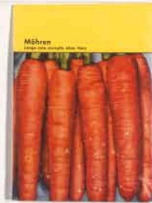
KP BREHMER Aufsteller 25 1967 (Kat. 11)

tischen Malerei mit größter Radikalität der Neukonstitution fotografisch erfasster Figuren- und Landschaftsmotive, die nun aus einzelnen »Lichtpunkten« gleichsam pointillistisch aufgebaut werden (Abb. S. 10). Das farbige Foto (in seiner Projektion als Diapositiv) wird in eine ganz neue Bildwirklichkeit überführt.