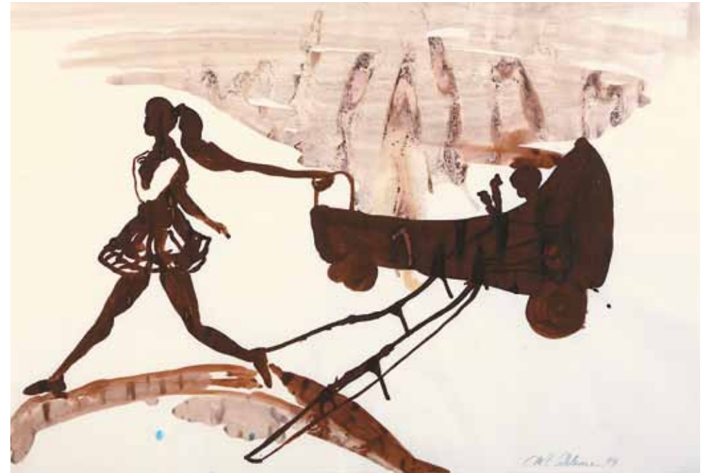
Ohne Titel, 1994 Bleistift, Tusche, 70 x 100 cm Hanck 1206