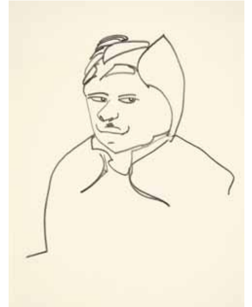
Fallensteller Zeichnung , 1993/94 Bleistift, je 21 x 15 cm Hanck 2035, 2037, 2036