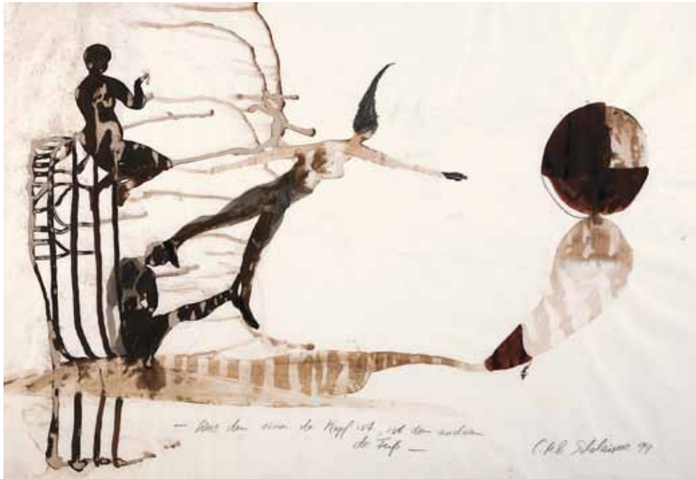
Ohne Titel, 1994 Bleistift, Tusche, 70 x 100 cm Hanck 1205