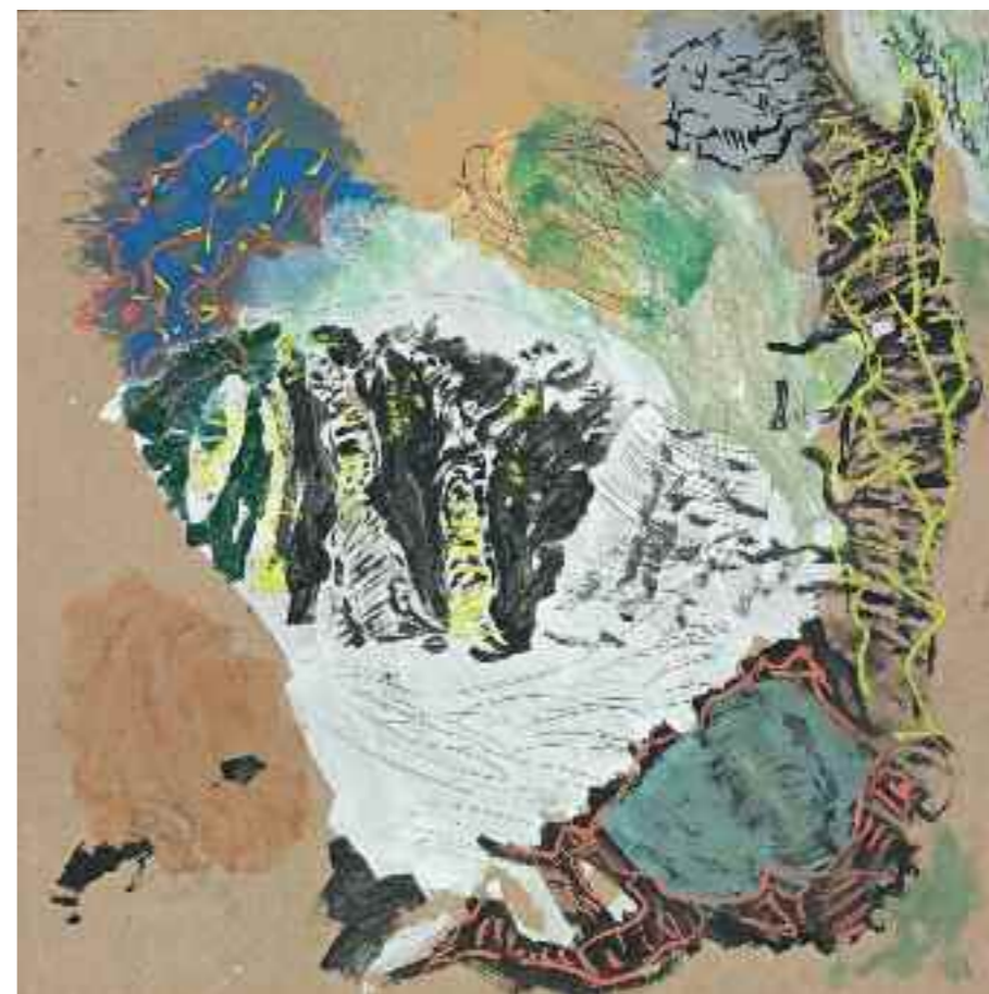
Ohne Titel 2011