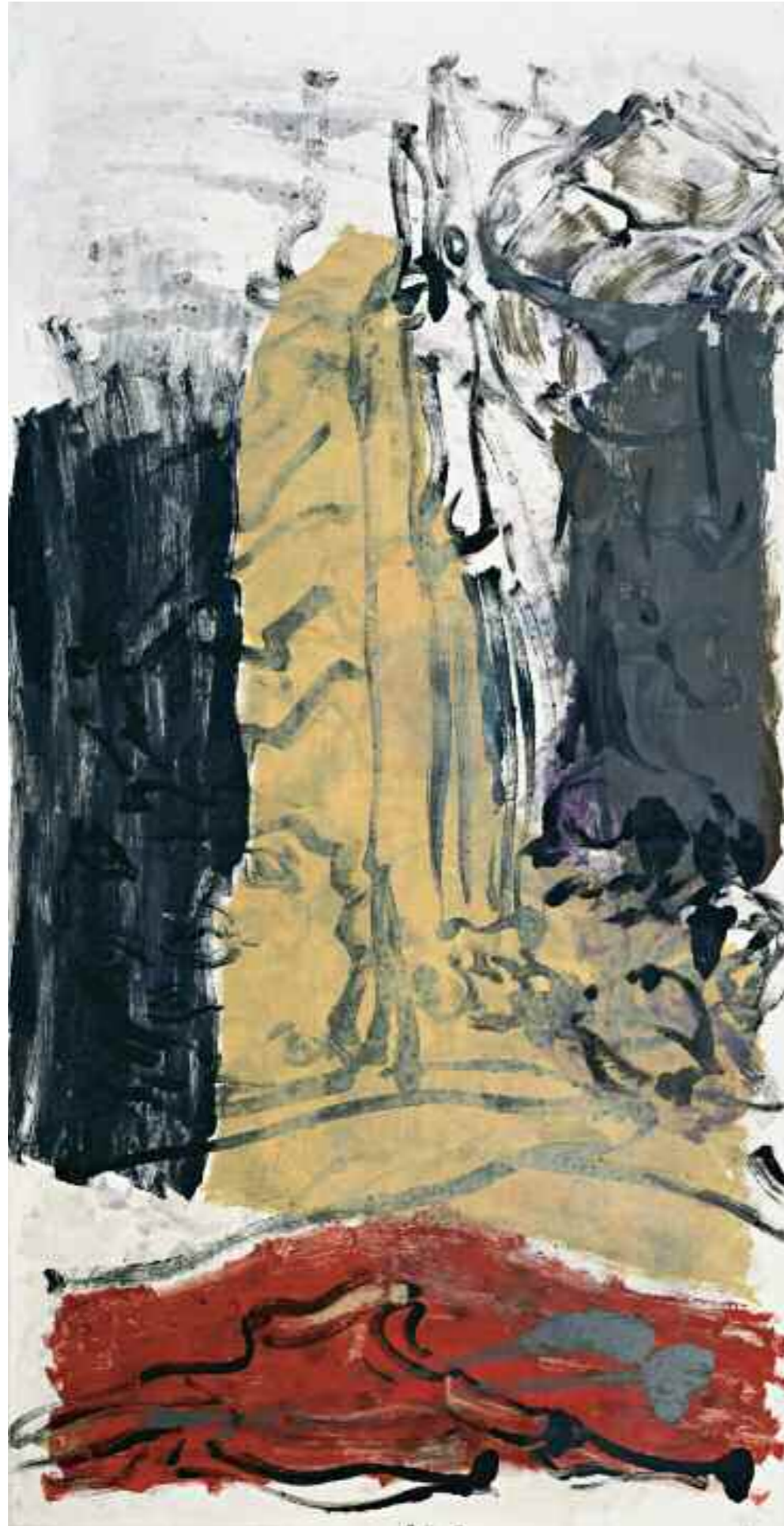
Ohne Titel 1988