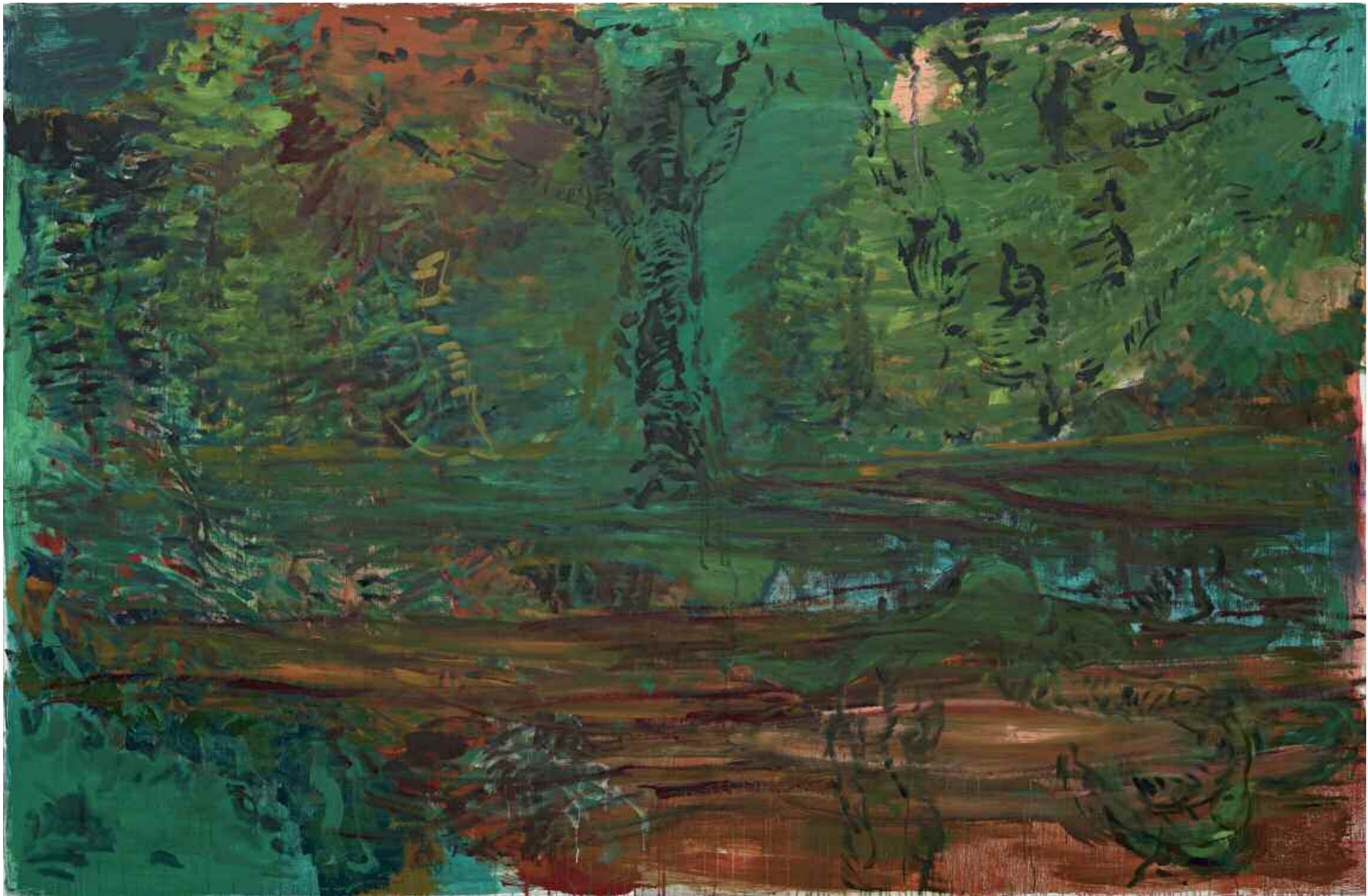
Ohne Titel 2012