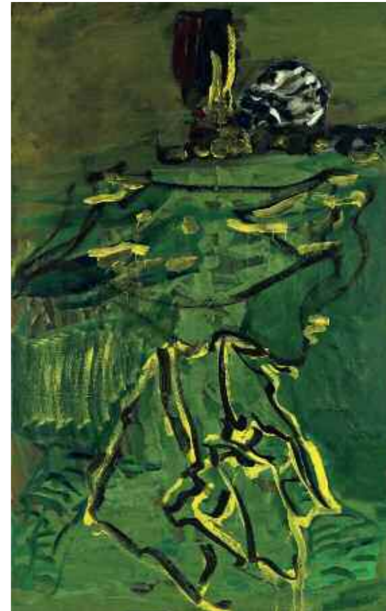
Ohne Titel 2009