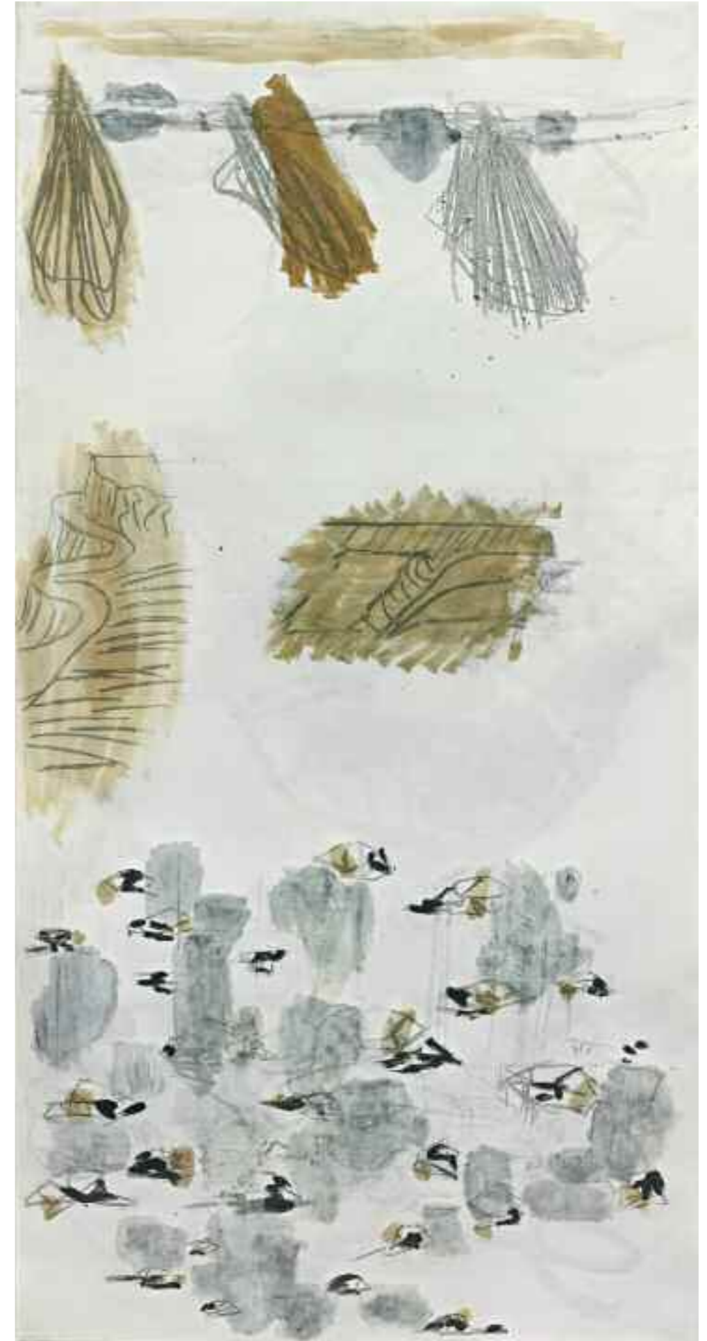
Ohne Titel 1993