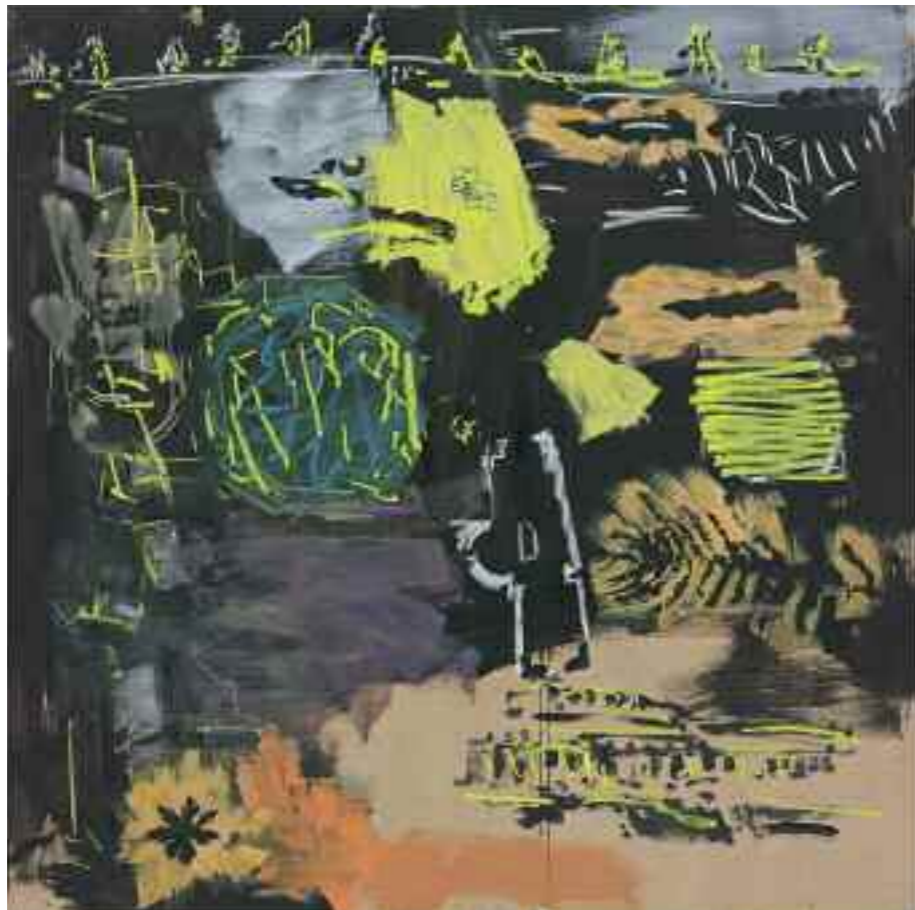
Ohne Titel 2011