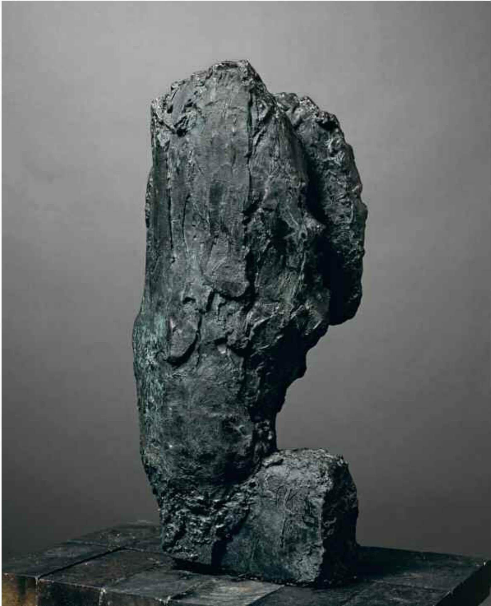
Laeso - Kopf I 1983