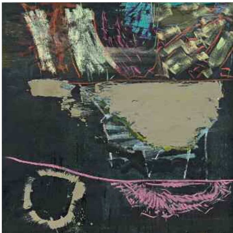
Ohne Titel 2011