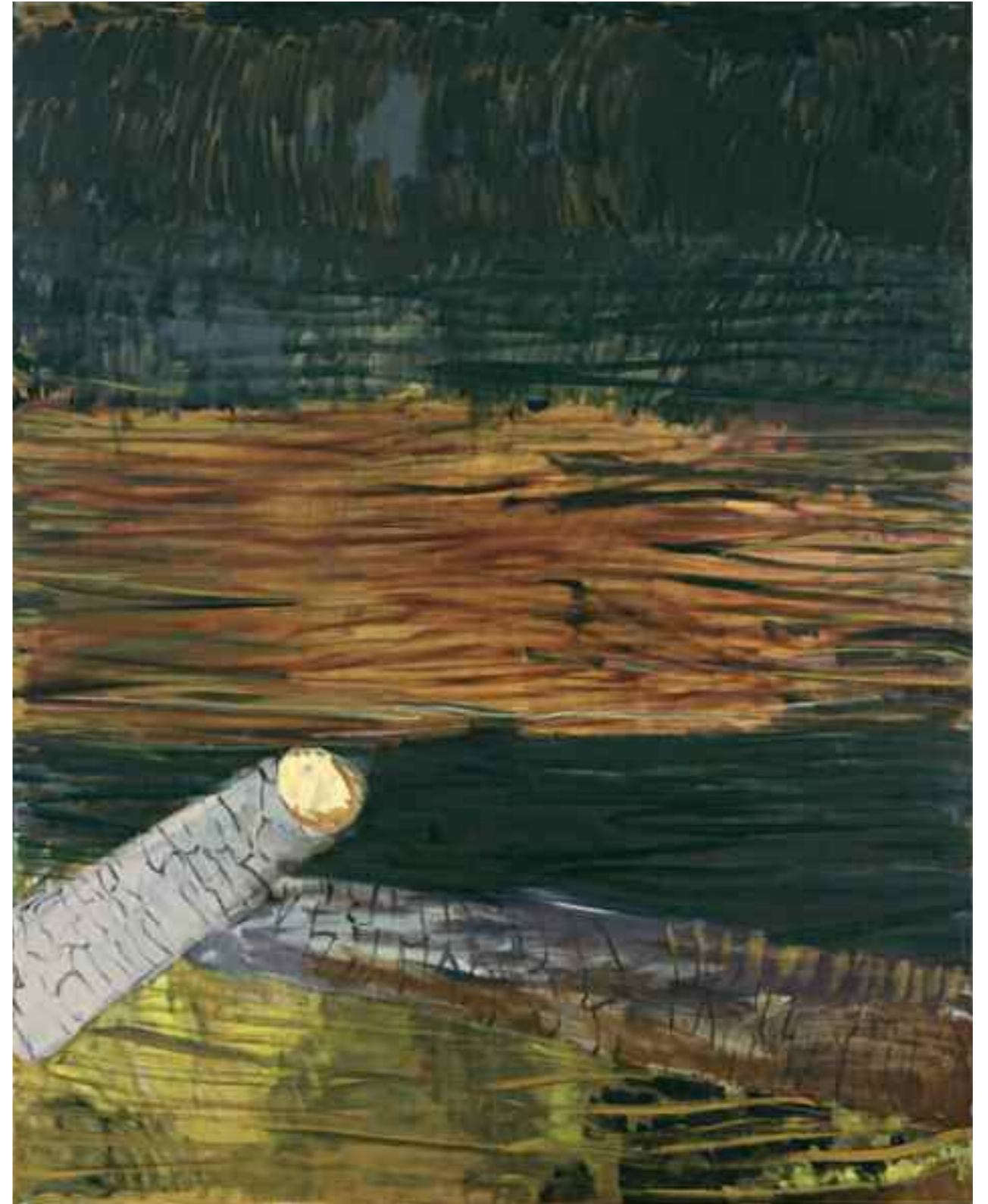
Ohne Titel 2001