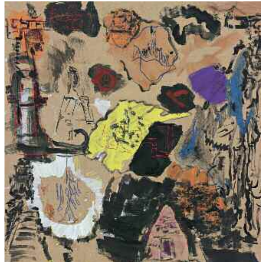
Ohne Titel 2011