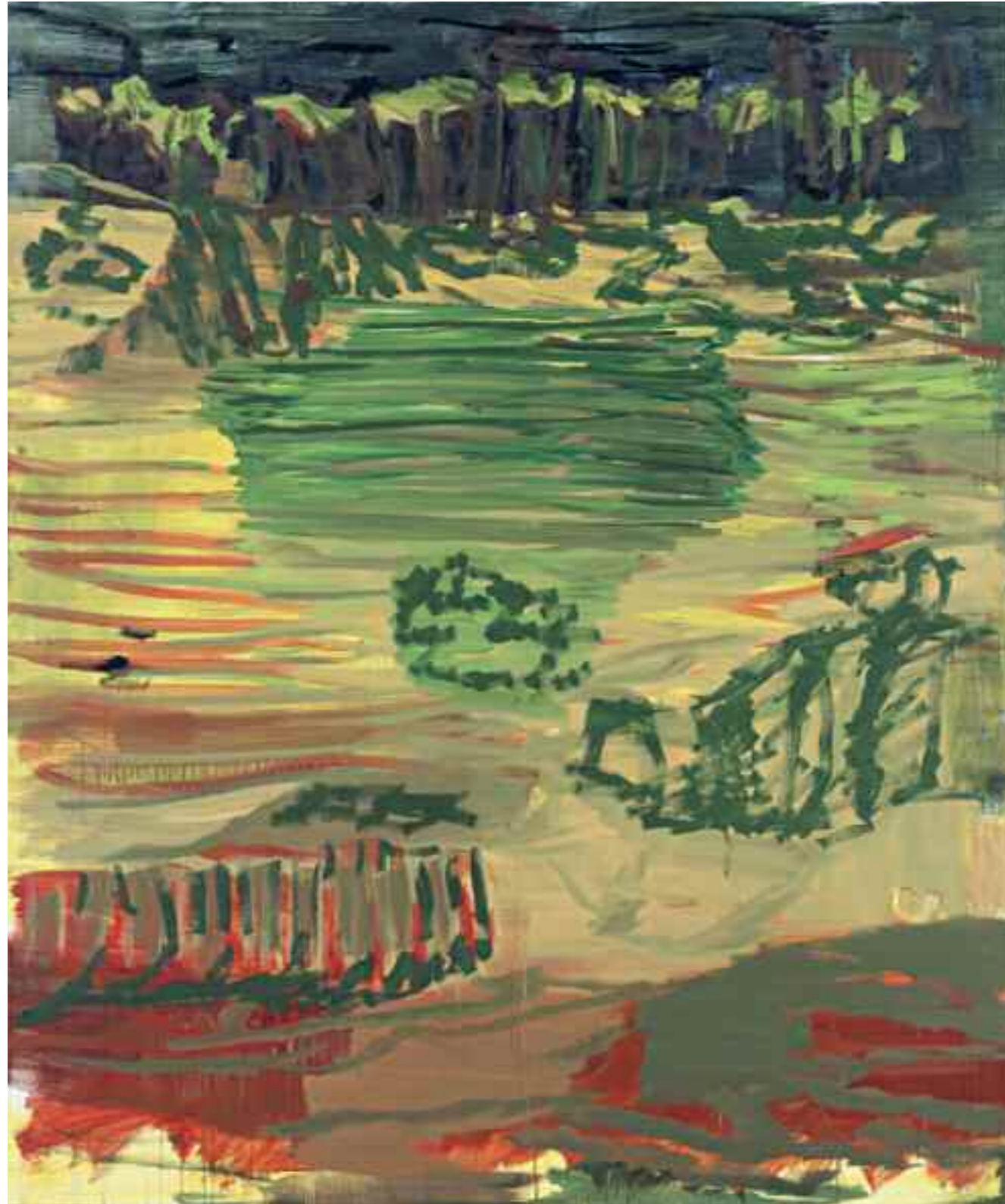
Ohne Titel 2009