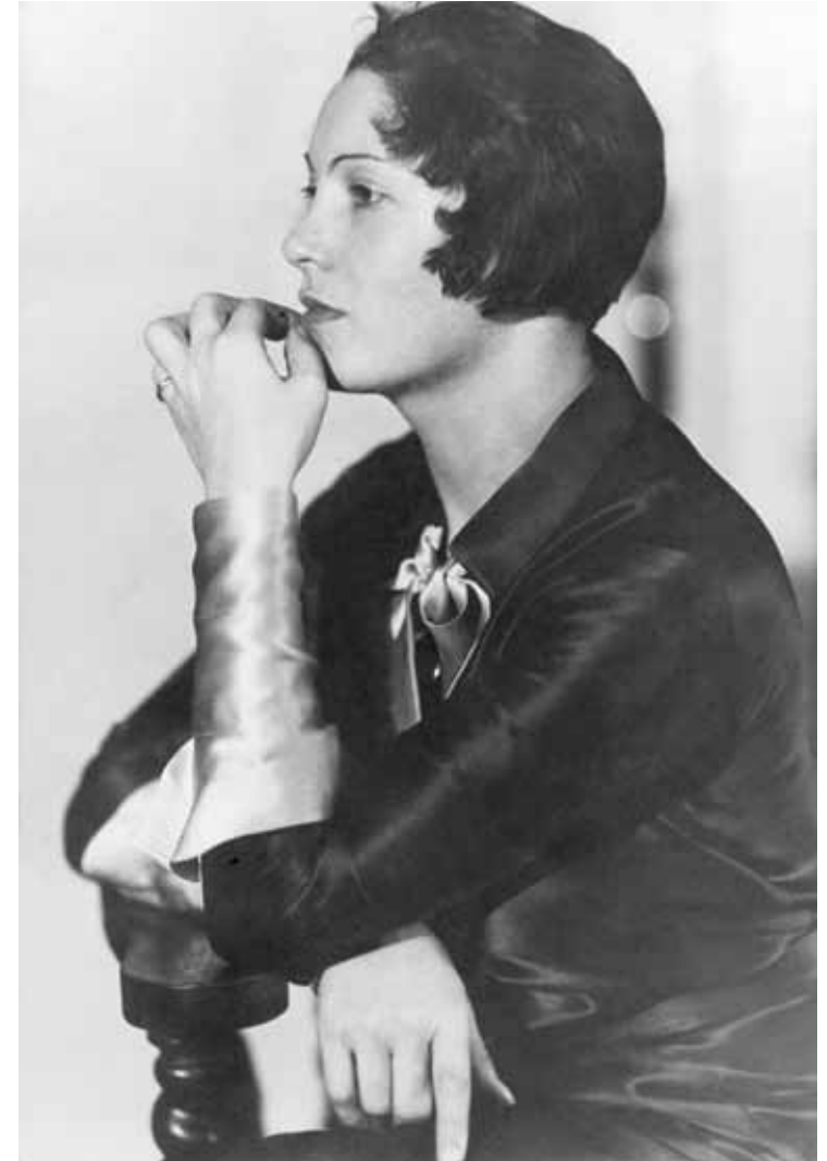
Carola Neher, Berlin 1932