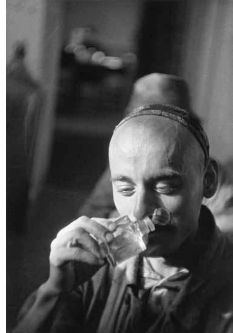
In der Fabrik für Ätheröle und Chemie, in der auch Parfüm hergestellt wird, Chodschent, Tadschikische SSR 1932