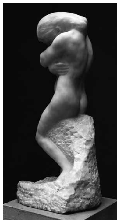
Abb. 18 Auguste Rodin, Eva , um 1900, Marmor, 77,5 × 28 × 32 cm, Skulpturensammlung der Staatlichen Kunstsammlungen Dresden, Inv.-Nr. ZV 1890