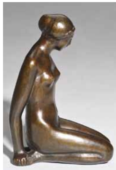
Abb. 17 Aristide Maillol, Kniende , vor 1900, Bronze, 19,5 × 13,8 × 9,5 cm, Fondation Dina Vierny – Musée Maillol, Paris

In engem zeitlichen Zusammenhang mit dem Besuch der Schule entstand eine bemerkenswerte plastische Idee: »Ich denke mir folgende Plastik wunderschön: eine schwangere Frau aus dem Stein gehauen. Nur bis zu den Knien herausgehauen, so daß es ist, wie Lise 44 in ihrer Schwangerschaft mit Maria sagte, »als ob ich ganz im Boden stecke«. Das Unbewegliche, Gebundene, Benommene. Die Arme und Hände schwer hängend, der Kopf gesenkt, die ganze Aufmerksamkeit nach innen. Und das Ganze in schwerem schwerem Stein. Dies soll heißen: die Schwangerschaft .« 45 Schwangerschaft als erdschwerer, lastender Zustand – hieraus spricht nicht nur die rein physische Veränderung des weiblichen Körpers, sondern auch eine psychosoziale Komponente, die im Umfeld der Künstlerin tagtäglich erfahrbar war. Als Gattin eines Kassenarztes in Prenzlauer Berg war Kollwitz mit den Bedingungen konfrontiert, unter denen Frauen ihre Kinder zur Welt brachten