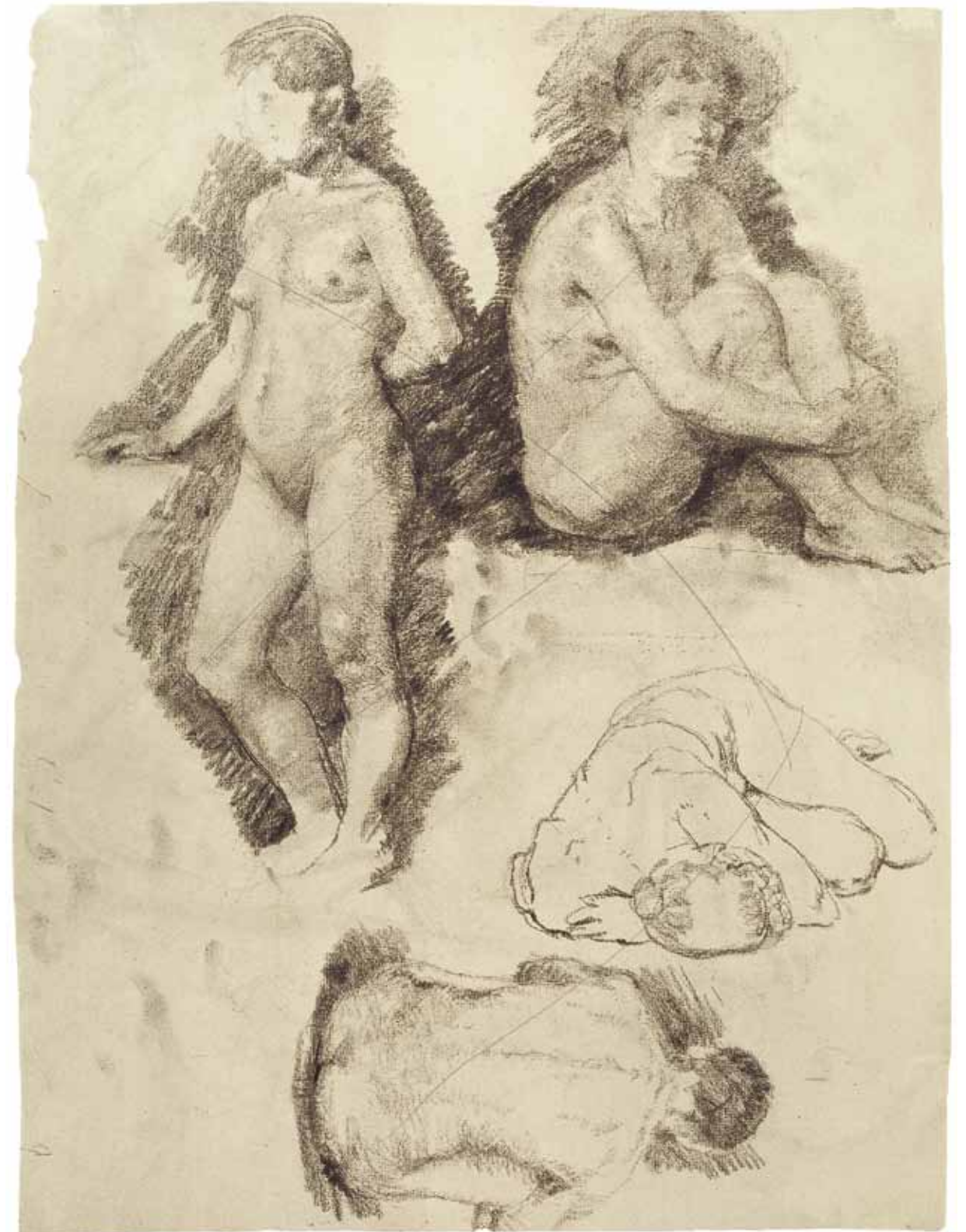
Abb. 28 Liegender männlicher Akt und Frauenkopf , 1888, schwarze Kreide, 47 × 61,5 cm, Museum Ludwig, Köln, Inv.-Nr. ML/Z 1962/042