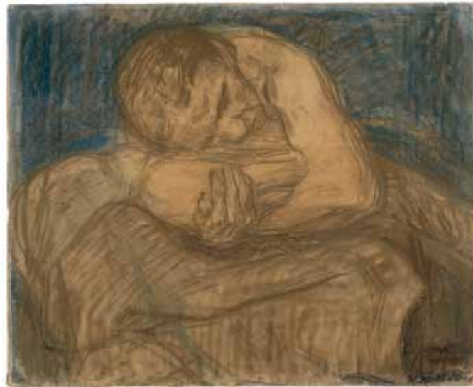
Abb. 33 Käthe Kollwitz, Frau mit totem Kind , 1903, braune und blaue Pastellkreiden, gewischt, schwarze und dunkelbraune Kreide, 48,1 × 58,4 cm, Käthe Kollwitz Museum Köln, Inv.-Nr. 70200/89003

Einige der bis 1941 insgesamt zehn angefertigten Zustände sind mit Wasser- und Deckfarben oder Fettkreiden in Gold, Blau, Grün, Gelb, Weiß oder Rosa überarbeitet. Das vorliegende, nicht farbig überarbeitete Exemplar stammt aus der 1921 vom Dresdner Verlag Emil Richter herausgegebenen Auflage.