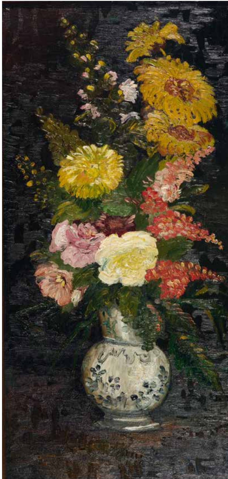
VINCENT VAN GOGH Vase mit Astern und anderen Blumen 1886 DEN HAAG