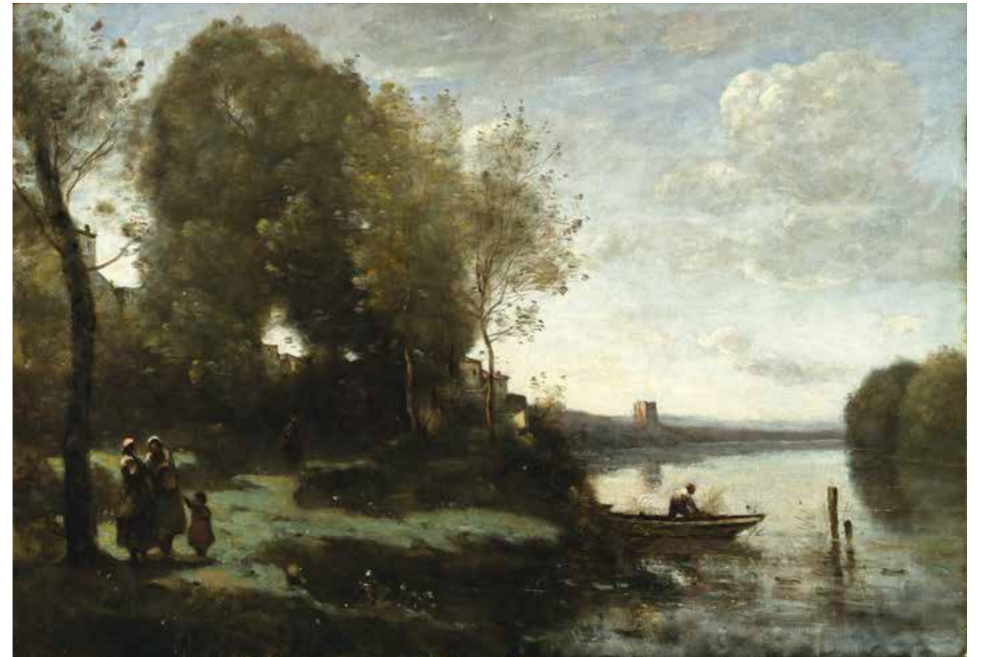
CAMILLE COROT Fluss mit einem entfernten Turm 1865 NEW YORK