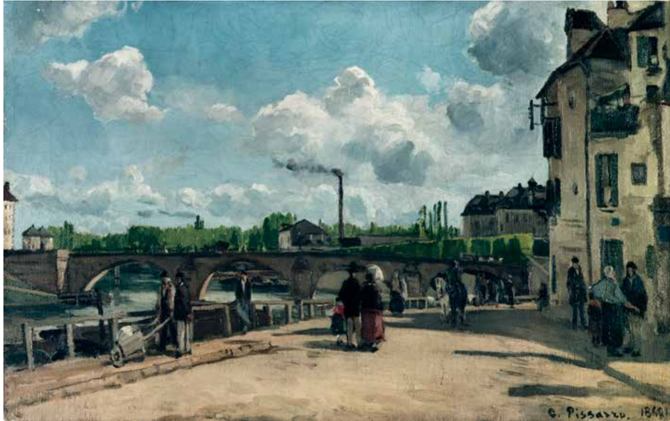
CAMILLE PISSARRO Quai du Pothuis, Pontoise 1868 MANNHEIM