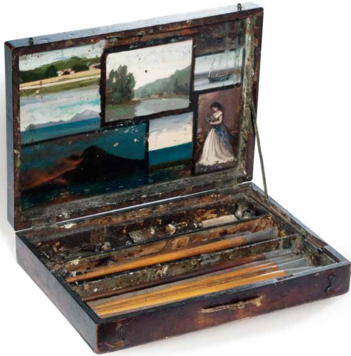
CAMILLE COROT Bemalter Malkasten 1822–75 DEN HAAG