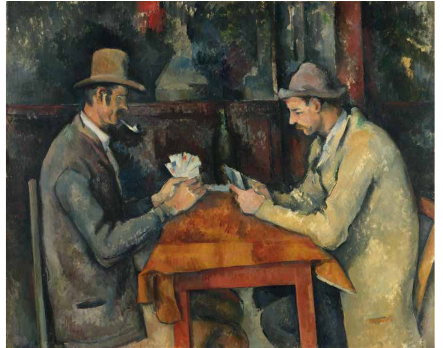
PAUL CÉZANNE Die Kartenspieler ca. 1892–95 LONDON