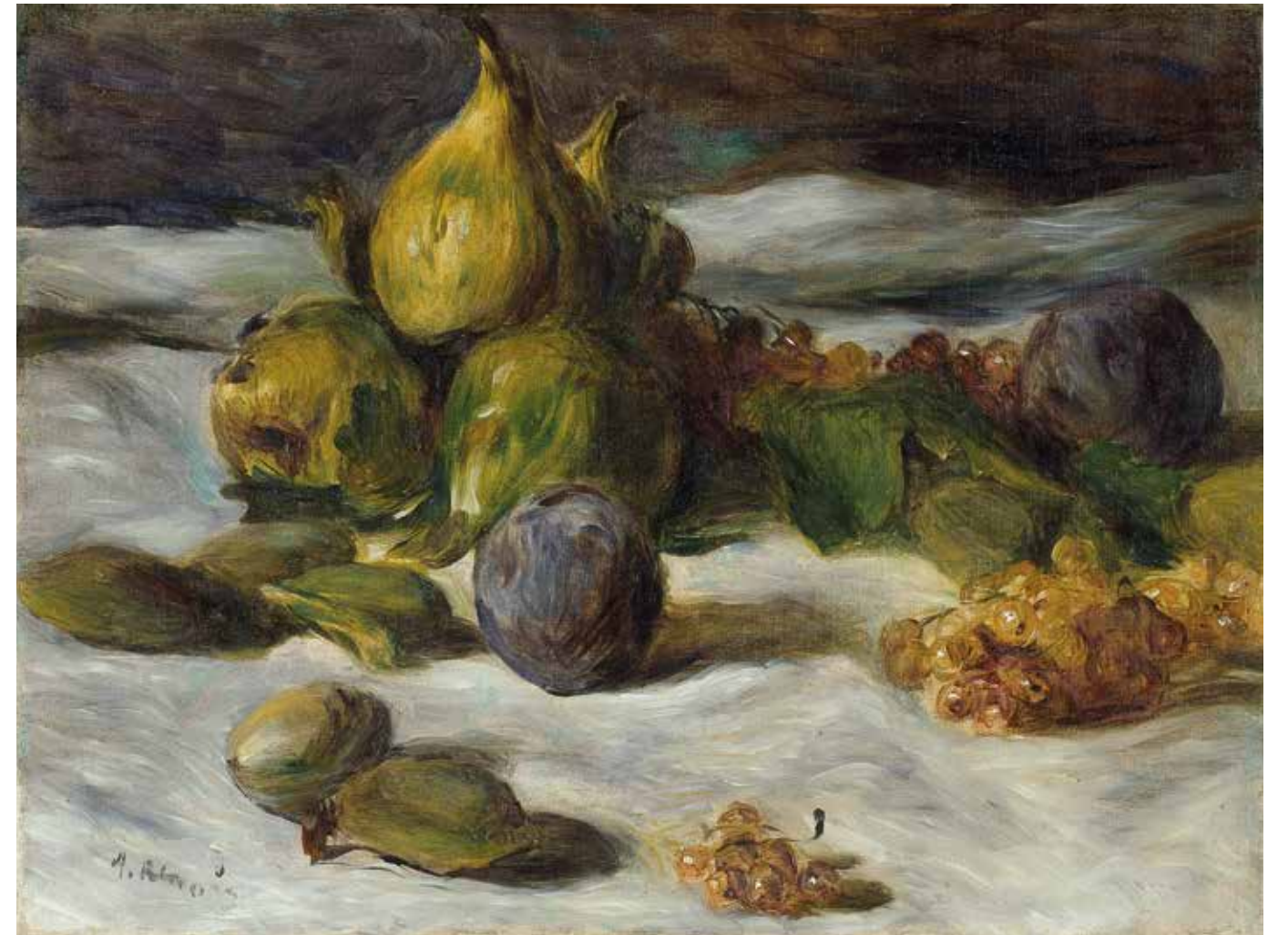
PIERRE-AUGUSTE RENOIR Früchtestilleben (Feigen und Johannisbeeren) ca. 1870/72 BREMEN