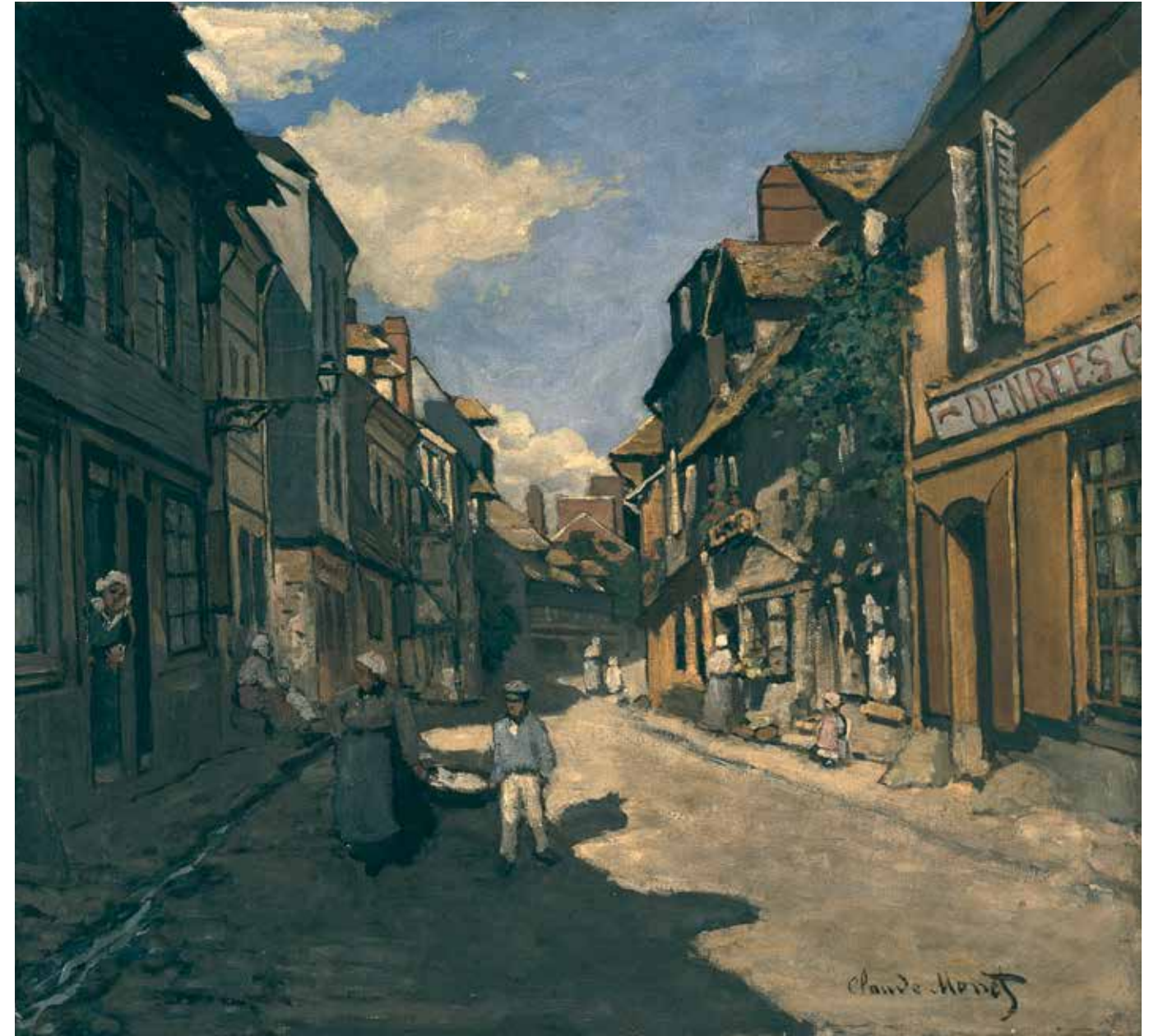
CLAUDE MONET Die Rue de la Bavoile in Honfleur 1864 MANNHEIM