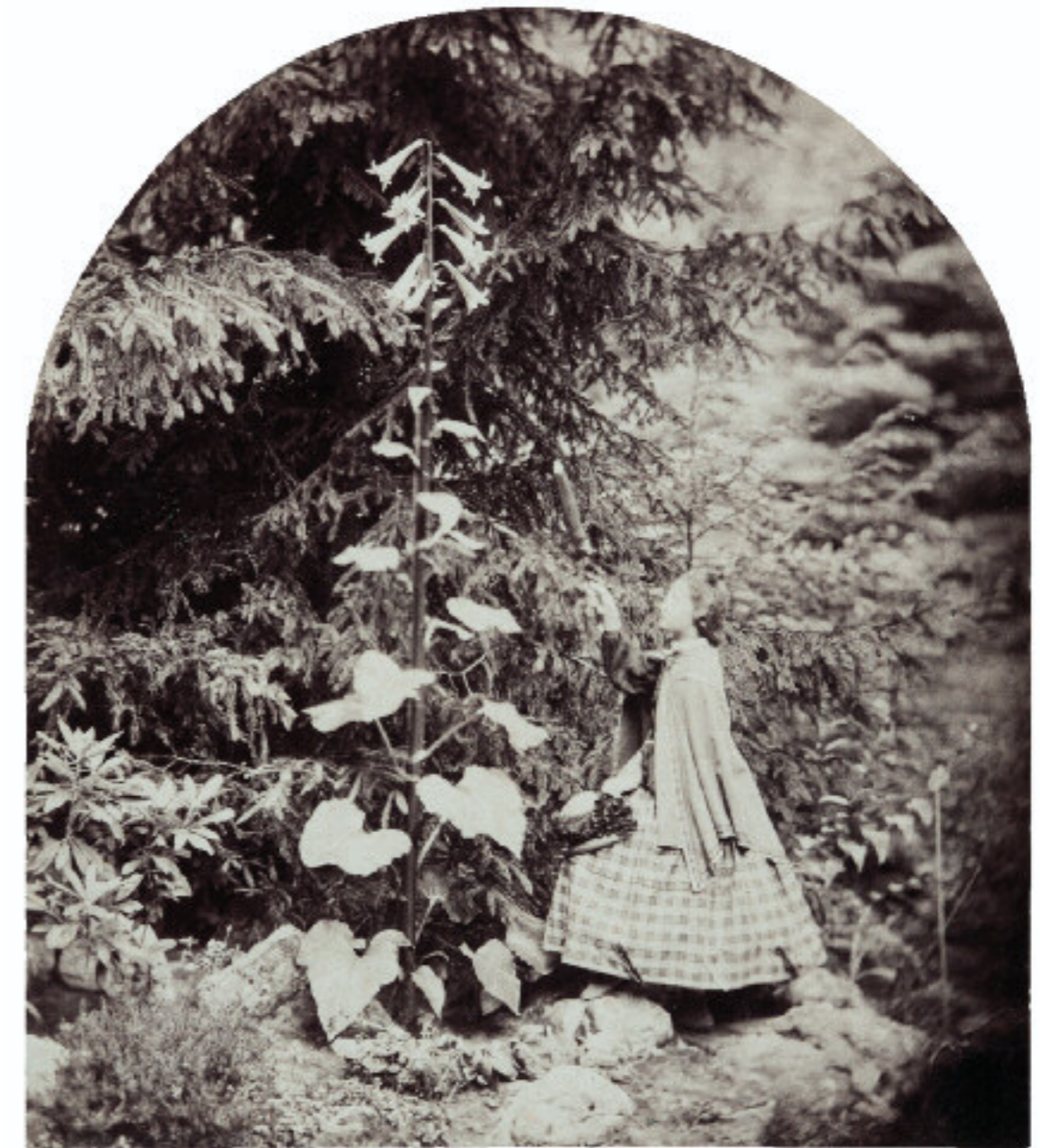
Carl Wilhelm Häcker Lilium gigantum. Im freien Lande blühend, Pirna, um 1862

Jedes Ausstellungsprojekt ist eine Teamleistung und deshalb gebührt mein besonderer Dank allen Mitarbeiterinnen und Mitarbeitern der Stiftung Museum Schloss Moyland, die auch in Zeiten immer enger werdender finanzieller und personeller Mittel unermüdlich die erfolgreiche Arbeit des Museums Schloss Moyland garantieren.