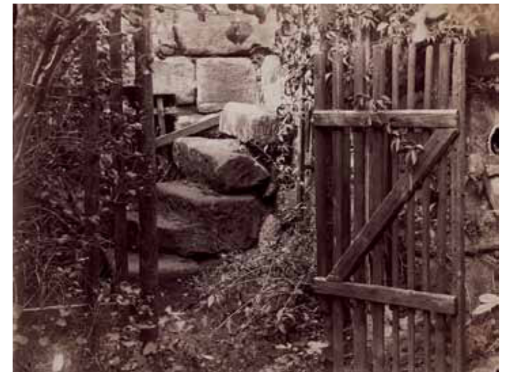
Carl Hertel Heidelberger Schloss, Pulverturm, vor 1878