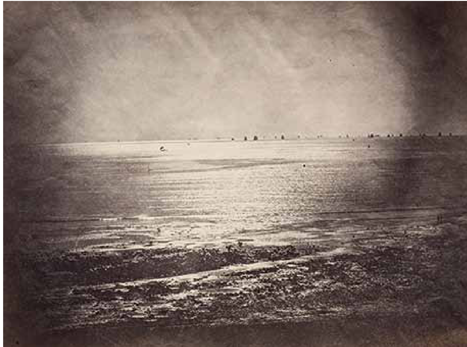
Gustave Le Gray Vue de mer (Meerblick), Normandie, 1856