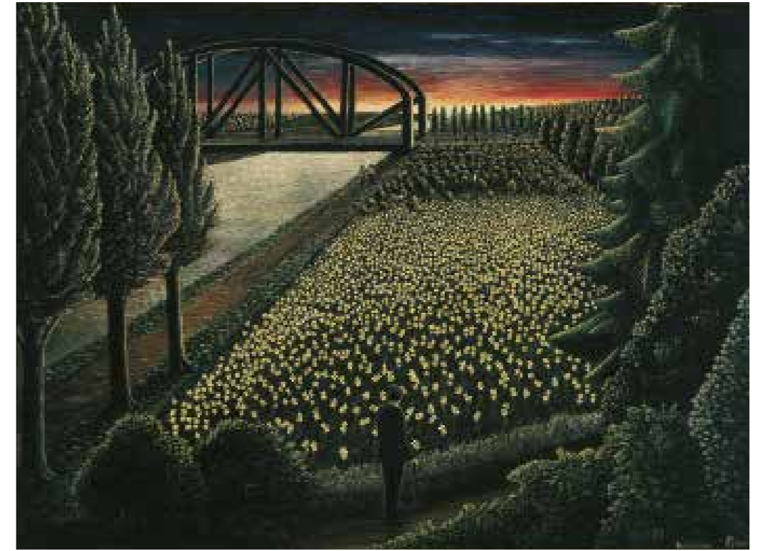
Friedrich Gerlach Nachtkerzen, 1963