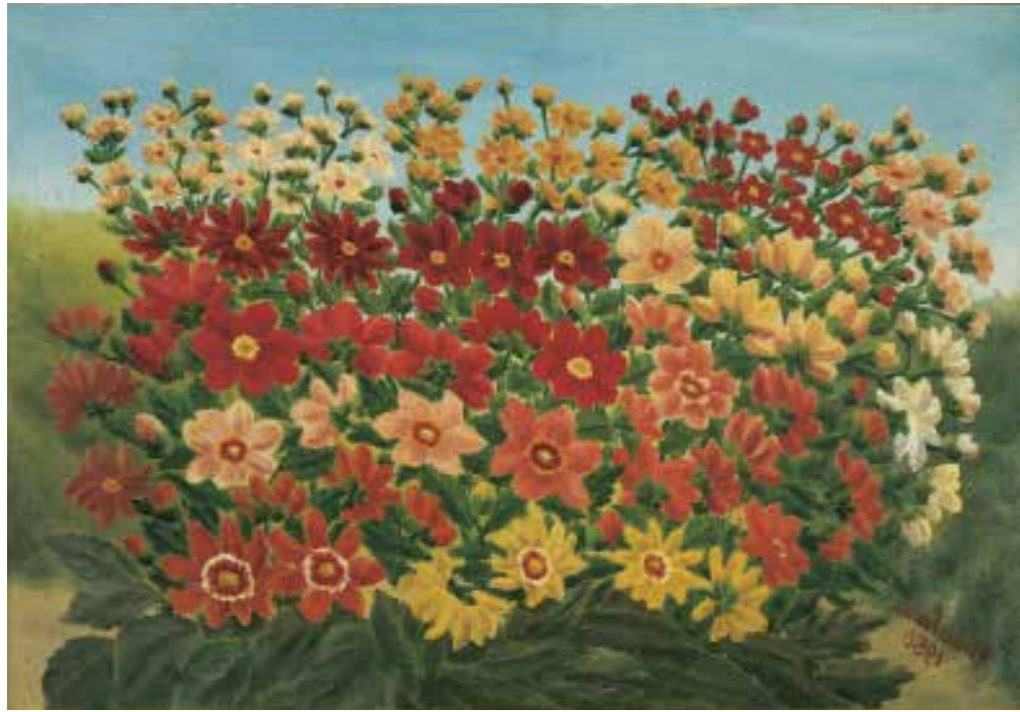
André Bauchant Le Bouquet , 1950