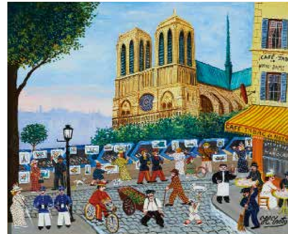
Hector Trotin Paris: Notre-Dame , um 1958/1960