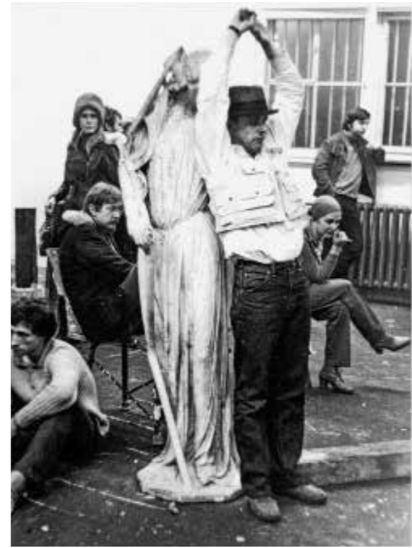
Erich Bödeker Joseph Beuys, 1970