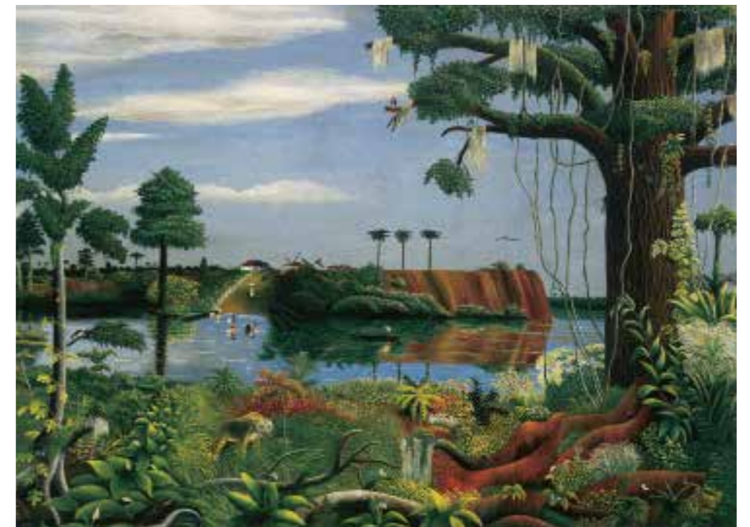
Ludwig Gerlach Am Rio Doce (Linhares), 1971