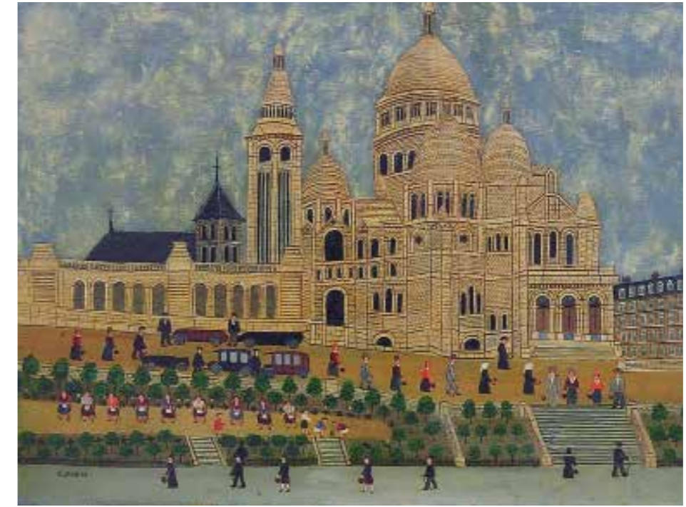
Louis Vivin Le Sacré-Cœur , 1925