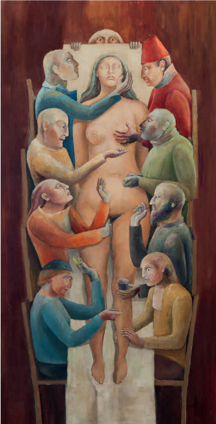
Tamara Kvesitadze, Symposium , 2017

Acrylfarbe und Tinte auf MDF auf Metall, 250 x 126 cm