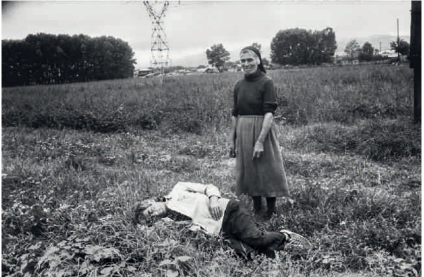
Natela Grigalashvili, Ohne Titel, aus den Serien Book of My Mother und Village of Mice , 1990–1995, 23 x 15 cm

geprägt. Ein archaischer Lebensstil, der durch die zentrifugalen Kräfte des modernen Lebens in Gefahr ist, zunichte gemacht zu werden. Und ein für Außenstehende interessanter Prozess, vor allem für Natela, die, wie schon Shakespeare in Hamlet feststellt, »der Natur gleichsam den Spiegel« vorhält, indem sie relevante Elemente in ihre Geschichte einwebt und damit den Fokus des Betrachters darauf lenkt, was für sie an dieser Geschichte so besonders ist.